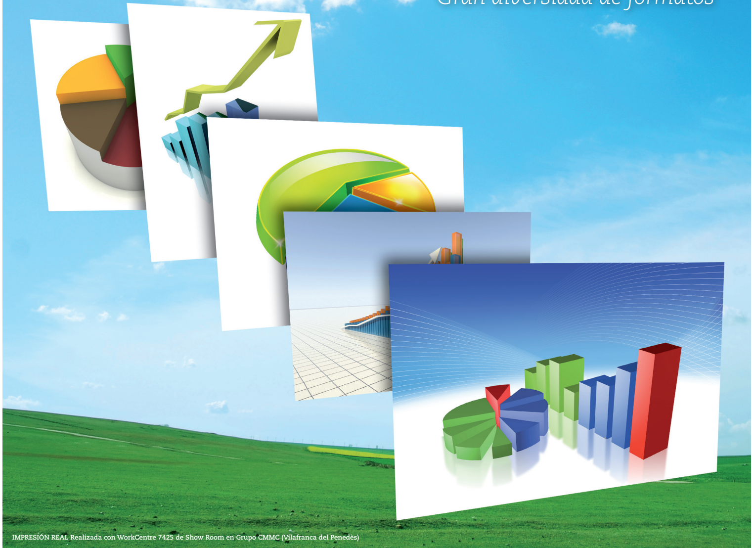
IMPRESIÓN REAL Realizada con WorkCentre 7425 de Show Room en Grupo CMMC (Vilafranca del Penedès)

Productividad en grupo a todo color Todo en uno: fax, escáner y copiadora Gran diversidad de formatos