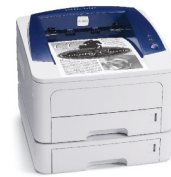
Phaser 3250 con Bandeja 2 opcional